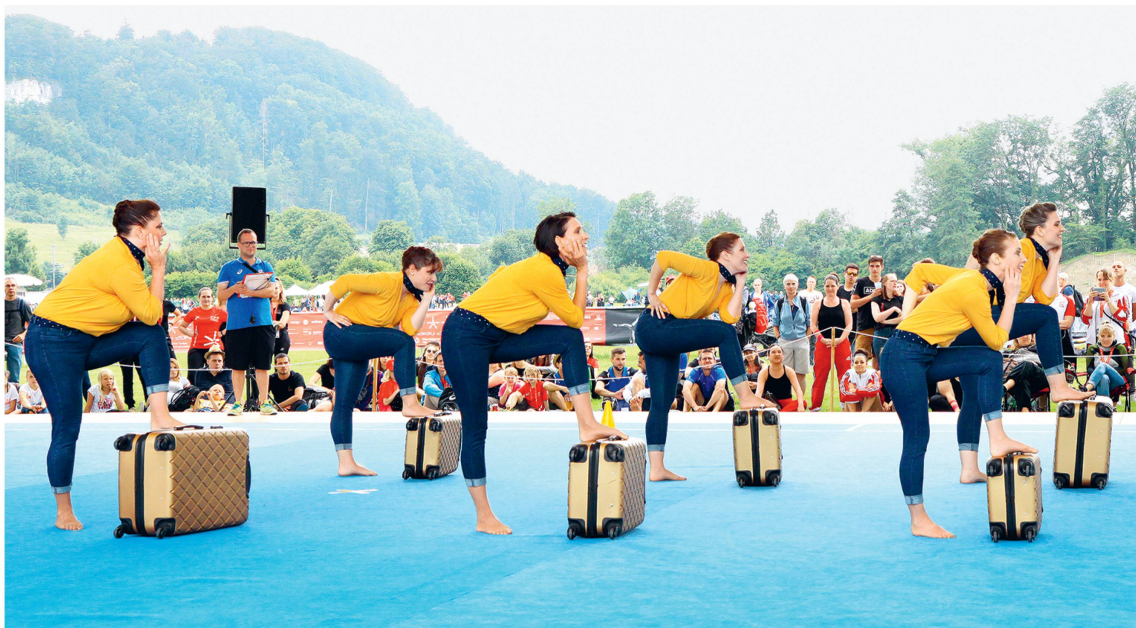
Fête fédérale 2019, Aarau : actives 35+ de Morges, gymnastique.

Il s'agit également d'enrichir l'offre d'activités pour les groupes de gymnastique pour tous, sans compétition si ce n'est des jeux: groupes 35/55 ans et plus, ou seniors, sans oublier les adolescents et jeunes actifs non spécialisés. L'Association et les sociétés ont perdu beaucoup de membres dans ces secteurs. Après un passage dans les groupes de parents-enfants et de gymnastique enfantine, le choix se limite souvent à la compétition, individuelle et de sociétés.