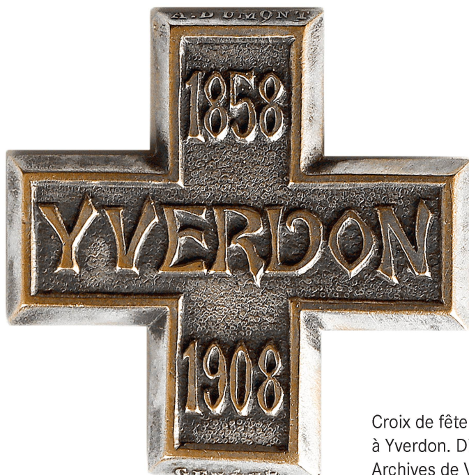
Croix de fête de la Cantonale de 1908 à Yverdon. Dimension réelle 26 mm. Archives de Vevey-Ancienne.

et même l'élection du jury des concours (au scrutin de liste). L'Assemblée annuelle des délégués se prononce sur les comptes, la gestion du Comité central, la nomination des membres honoraires, l'attribution des fêtes 7 . Cette structure, calquée sur les institutions politiques, n'est pas sans inconvénients : le fonctionnement est lent et les diverses élections témoignent parfois d'antagonismes entre régions. Les innovations techniques proposées sont soumises au vote et peinent à convaincre les sociétés qui n'ont pas la possibilité d'adapter leur infrastructure (local, terrain, engins).