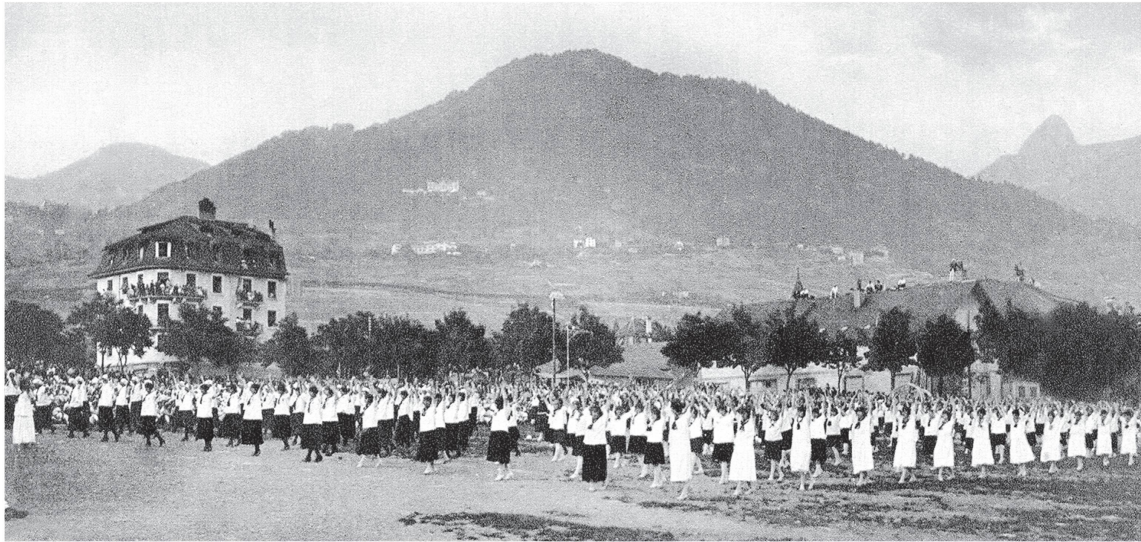
Fête cantonale 1923, Montreux: exercice d'ensemble de gymnastes féminines: tenues blanches ou bleu-blanc (style « marin»). La Patrie suisse , 18 juillet 1923 – Archives de Vevey-Ancienne.

partie obligatoire. Les gymnastes féminines ont conservé leurs exercices d'ensemble jusqu'à la fin du siècle, mais y ont renoncé ensuite pour les mêmes raisons. Le culte sur la place de fête a disparu depuis une cinquantaine d'années.