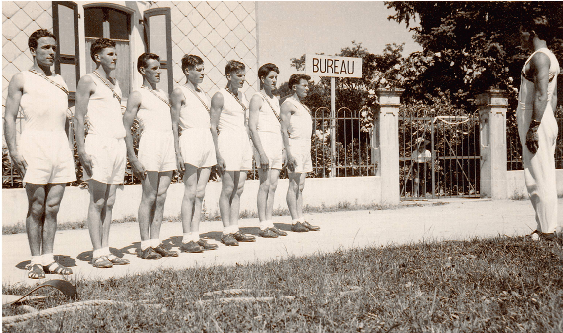
Fête régionale 1952, Yvonand : la section de Montagny, garde-à-vous, sautoir, olympiques et cuissettes.

L'évolution du sport en général, la concurrence avec les jeux, le football par exemple, l'importance grandissante des compétitions internationales ont progressivement renversé l'importance des critères : la technique et l'exécution des éléments ont pris de plus en plus de poids. Les membres n'ont pas attendu mai 1968 pour se détourner des formes militaires qui se sont assouplies progressivement et qui ont définitivement disparu de la gymnastique masculine au milieu des années 70. L'utilisation de la musique et la mixité ont ensuite amplifié le mouvement vers une gymnastique dans laquelle « l'impression générale » et « l'ensemble » sont désormais jugés avec des critères chorégraphiques.